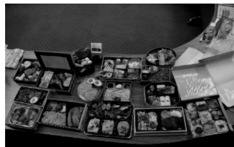
多彩なお弁当をお持ち寄り

▼ 学習は中央本部が発行した「21世紀に生きるあなたの組合員テキスト」を参考に1年間学習を行うことを事務局で確認し、それにもとづき事務局のKさんから学習会をおこな